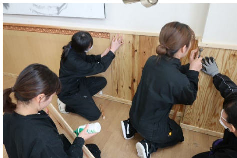
腰壁を貼っています