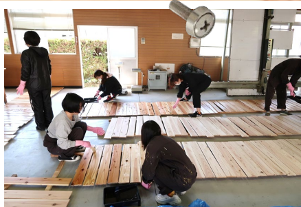
クリア塗装をしています