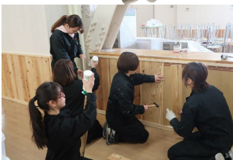
頑張って作業をしています